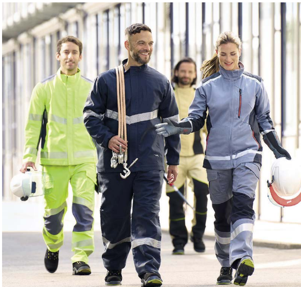
Schutzlösungen von Kopf bis Fuß in den verschiedenen PSAgS-Schutzklassen

Beim Löschen wird nicht mit einem Löschmittel wie einem Feuerlöscher